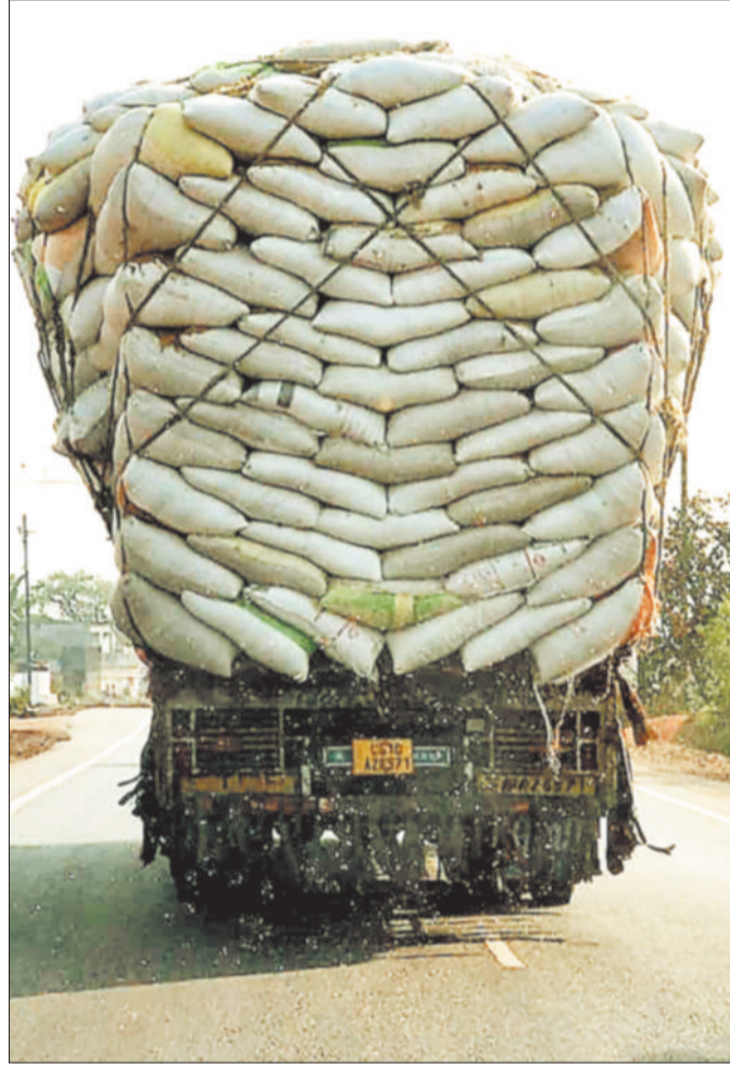
सड़क पर दौड़ रहे ओवरलोड ट्रक।