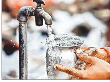
प्रथम तल पर कंट्रोल रूम (दूरभाष नं. 07752-471224) बनाया गया है।