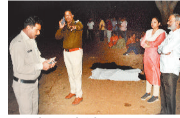
मामले की जानकारी लेती पुलिस।