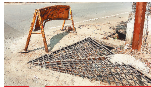
शहीद चौक यातायात थाने के पास लगाई गई चेंबर में जाली।